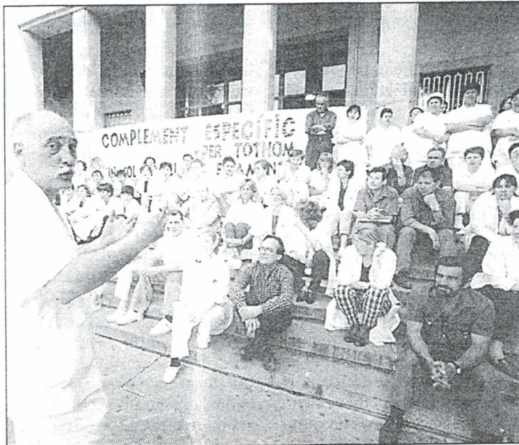
Treballadors del Trueta, ahir al matí davant l'hospital.

■ Girona. — Treballadors de l'Hospital Josep Trueta de Girona es van concentrar ahir al matí davant el centre per reclamar que tot el personal cobri el que s'anomena complement específic. Es tracta d'un complement d'incentivació que ja cobrava una part del personal sanitari. Segons un acord de l'octubre passat a partir d'aquest any ja l'havia de cobrar progressivament tot el personal, però com que això no s'ha produït els treballadors han decidit mobilitzar-se. / T.B.