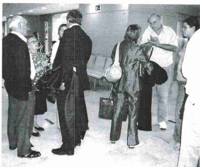
Alguns dels afectats pel contagi, parlant amb els advocats, ahir després del primer dia de judici.

L'acusada va explicar que el sèrum amb heparina s'utilitza per netejar la via abans i després de l'administració d'un medicament a un pacient i va admetre que únicament és possible que hi hagi contacte amb la sang en el moment d'administrar sèrum o medicaments a través d'una via. A partir de les declaracions dels afectats, es va posar en relleu que les quatre infermeres que treballaven la nit del 4 de juny del 2000 feien indistintament diferents tasques i que la infermera que obria la via a un pa-